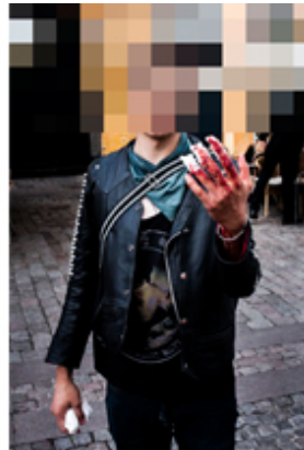
Figura 1. Izquierda: Símbolo Grinder. Derecha: Un caso de autoimplante de tres imanes en los dedos

Algunas de las prácticas asociadas al biohacking contemplan implantes de imanes en los dedos de las manos, tatuajes funcionales, implantes sonoros, hackeo de prótesis óseas o cardíacas, armaduras subcutáneas, control artificial de músculos, visión infrarroja, implantes de artefactos como relojes y teléfonos entre otras. En la mayoría de los casos los mismos biohackers son los encargados de llevar adelante las intervenciones sobre su propio cuerpo, valiéndose de foros de ayuda online, para compartir sus experiencias, celebrar sus éxitos y consultarse de qué manera autoanestesiarse, cortarse, implantarse y coserse la piel para lograr la buena cicatrización del cuerpo o bien para saber si alguno de ellos sabe qué nervio cortar o qué circuito implantar para extender la visión y poder captar, además del espectro visible, luz infrarroja y ultravioleta.