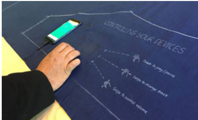
Figura 3. Proyecto Jacquard.